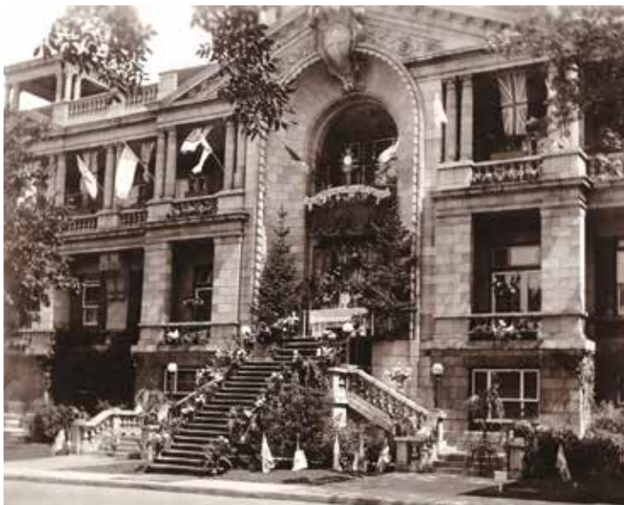
Façade de l'académie Querbes lors de la Fête-Dieu.

1. Rumilly, Robert. Histoire d'Outremont (1875-1975) , p.191.