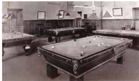
La salle de billard.