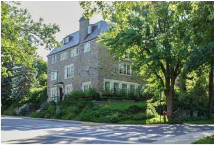
La propriété d'Henri S. Labelle au 660, avenue Hartland.