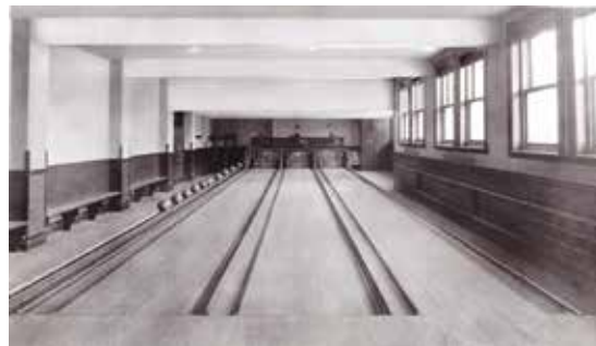
La salle de quilles.