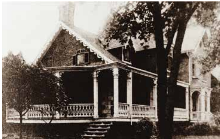
Le Woodside Cottage sur le chemin de la Côte-Sainte-Catherine à Outremont.

Un des anciens propriétaires, Rosario Martineau, fit entreprendre en 1931 des travaux majeurs de transformation, par le célèbre architecte Aristide Beaugrand-Champagne. Il remplaça la véranda frontale par une remarquable baie vitrée, recouvrit la maison de son caractéristique crépi blanc et la scinda en deux