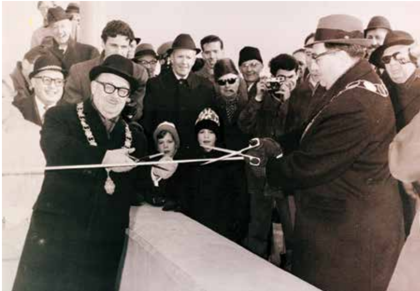
Le maire Bernard Couvrette (Ville d'Outremont) et le maire Reginald J.P. Dawson (Ville Mont-Royal) procèdent à la coupe de ruban symbolique pour l'inauguration du viaduc Rockland.

Version abrégée d'un article paru dans le Journal d'Outremont , Édition Hiver 2023-2024