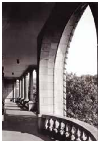
Un coin de galerie.