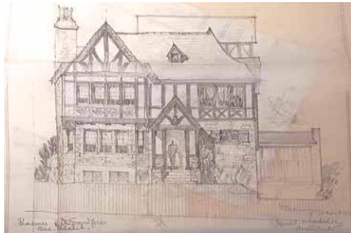
Plan de résidence sur l'avenue Belœil.